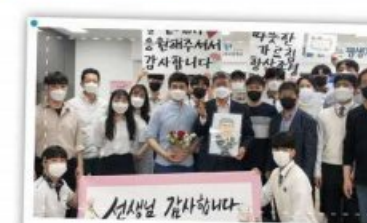
선생님 감사합니다! 선생님과 나누는 마음! 스승의 날 만남!