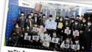
깨끗한 몸과 깨끗한 마음! 내교 제로 행사!