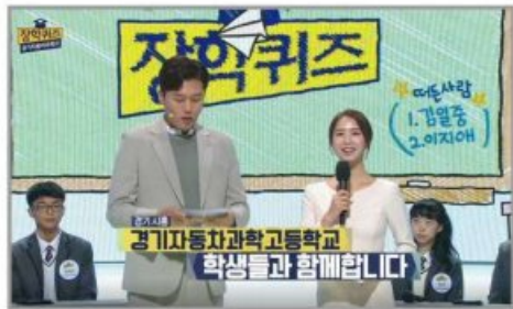
[ 장학퀴즈 ] 장학퀴즈 (2020. 05. 24.)