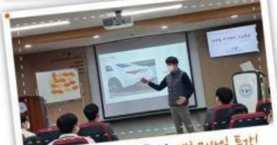
최고의 기업에서 온 특강! 벤츠모바일 특강!