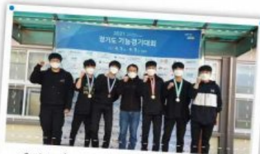
2021 기술경기대회 자동차 부문 최다수상!