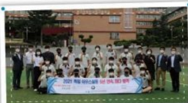
5년간 아우스빌을 전국 최다합격(83명)!