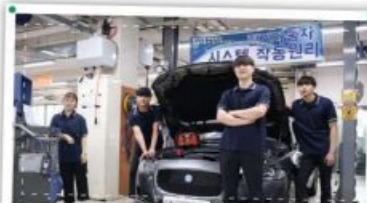
미래자동차과에서 만나세요! 전기자동차!