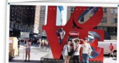
미국으로! 독일로! 세계로 향하는 해외 연수!