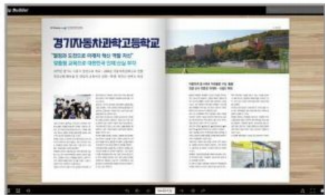
[ EV매거진 ] 6월호 EV Dreams 특집기사 게재 (2021. 06.)