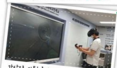
가상으로 자동차를 수리한다! VR/AR 전문가!