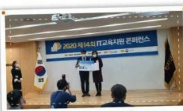
정보의 힘이 미래의 힘! IT 정보교육 우수상 수상!