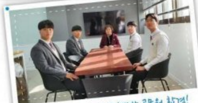
우리는 공무원이야! 미래인재반 공무원 합격!