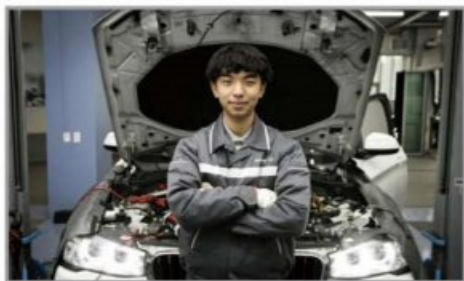
[ 중앙일보 ] 차 엔진이 교과서! 나는 '마스터' 꿈꾸는 19세 자동차 정비사입니다. (2017. 12. 01.)