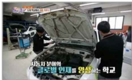
[ KBS ] 2TV 생방송 아침이 좋다 (2018. 06. 12.)