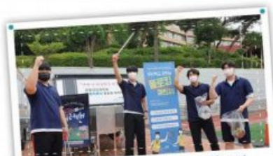
지속가능 환경을 만들자! 플로깅 챌린지!