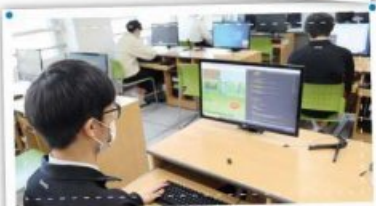
재능 뽐낼! 실력 뽐낼! 군내기술경기대회!