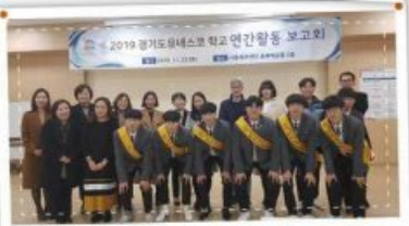
세계와 함께 걸어간다! 유네스코협력학교!