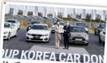
우수 기업이 먼저 신뢰하고 지원! BMW 차량기증!