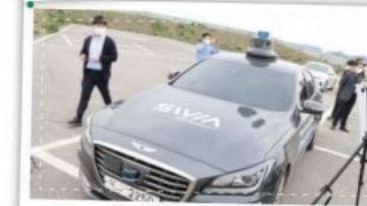
자율주행자동차를 먼저 만나다! K-city 체험!