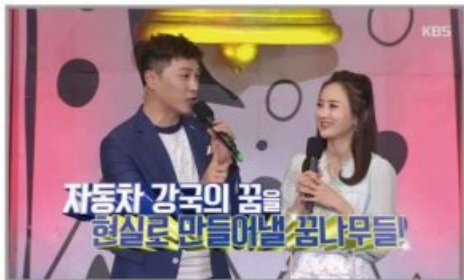
[ KBS ] 2TV 도전! 골든벨 (2016. 04. 03.)