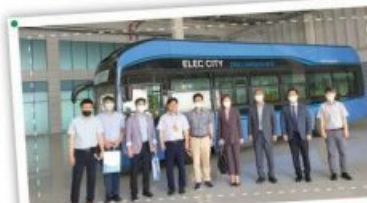
서울대에서 먼저 알아본 자율주행센터 협약회!