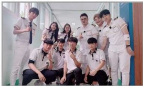
[ 채널A ] 같이할래GG (2019. 07. 20.)